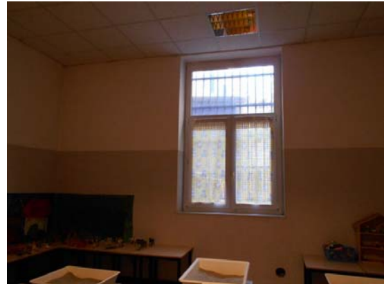
Figura 2.1 - Particolare dei serramenti