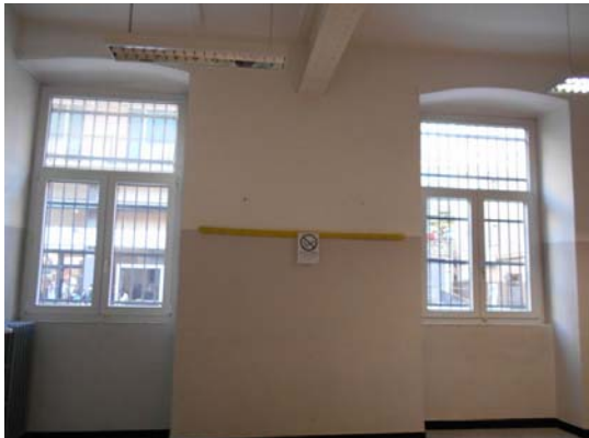
Figura 2.2 - Particolare dei serramenti