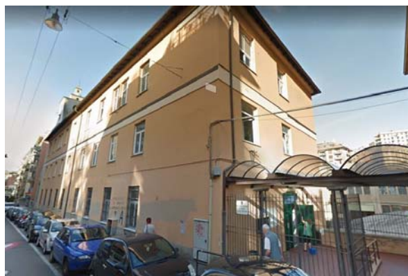
Figura 1.1 - Particolare della facciata principale

L’involucro edilizio opaco che costituisce l’edificio è composto da murature portanti costituite prevalentemente da mattoni pieni, intonacate esternamente. La copertura dell’edificio è realizzata in legno e del tipo a padiglione.